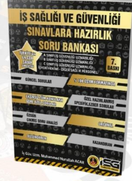
SINAVLARA HAZIRLIK SORU BANKASI