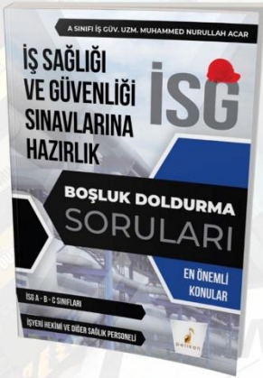
BOŞLUK DOLDURMA SORULARI