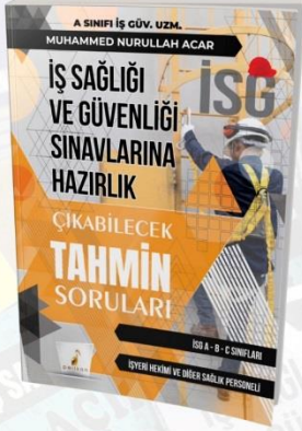
SINAVLARA HAZIRLIK TAHMİN SORULARI