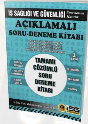
AÇIKLAMALI SORU- DENEME KİTABI