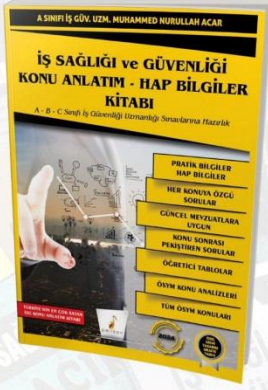
KONU ANLATIM HAP BİLGİLER